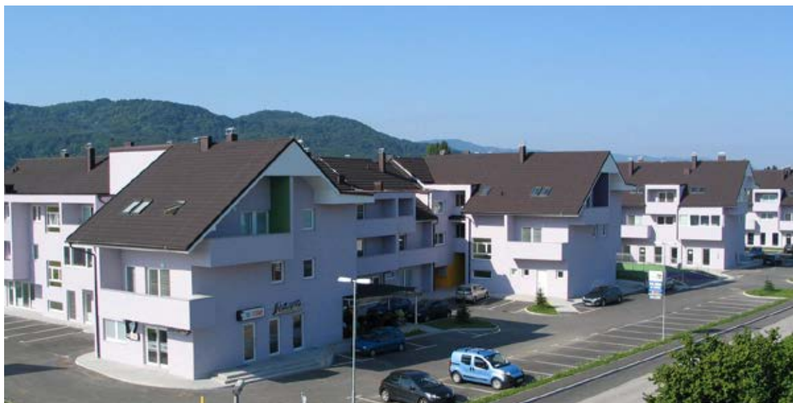
SPO Trobentica Brežice

investicijski in izvajalski inženiring - Boršt d.o.o.